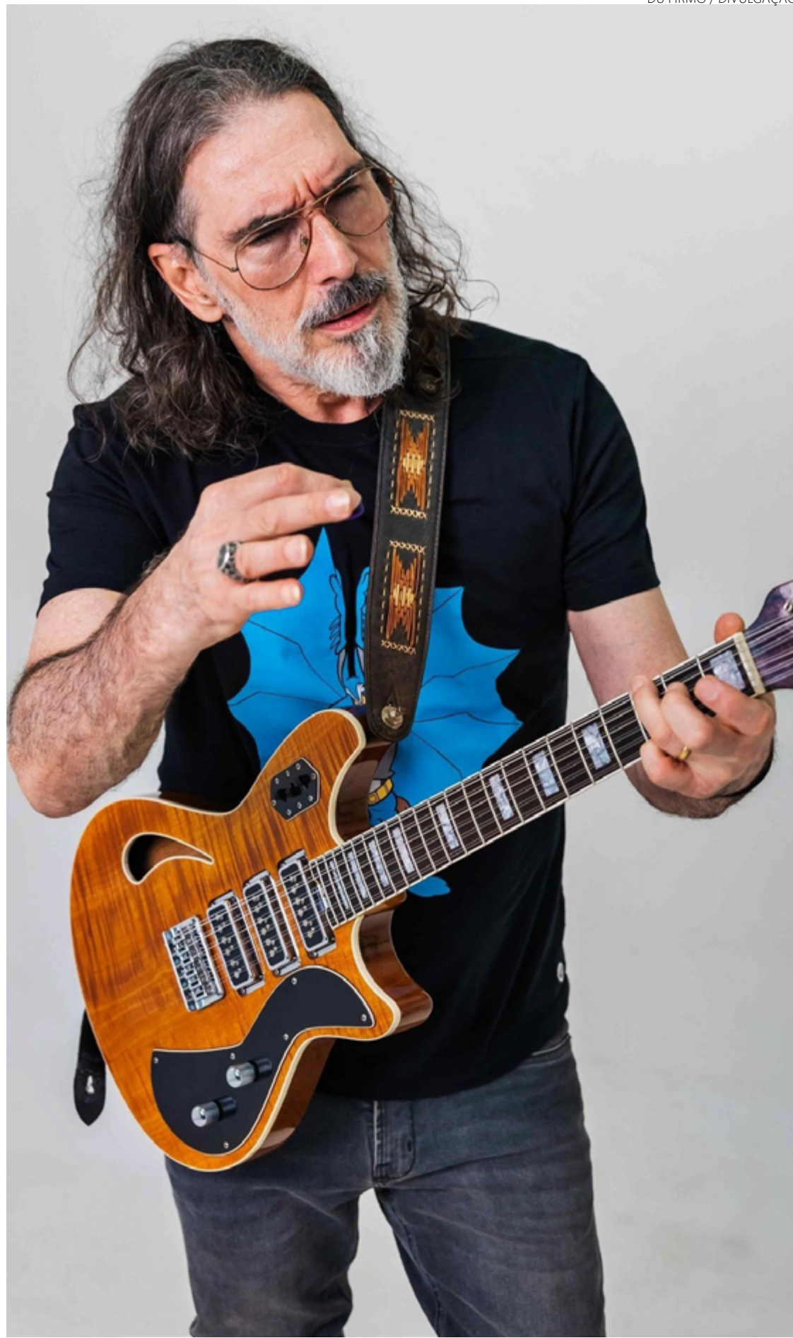
Músico debutou no cenário cultural brasileiro há cinco décadas