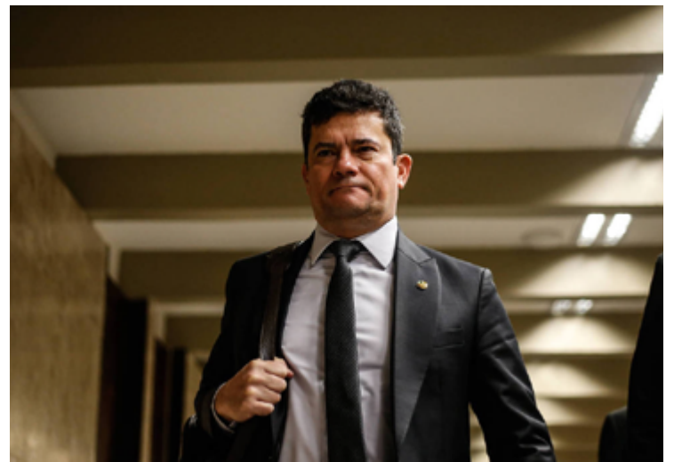
Sérgio Moro: mandato mantido na Justiça do Paraná

Quatro desembargadores seguiram o voto do relator Luciano Carrasco Falavinha Souza e entenderam que as acusações não procedem e que, por isso, Moro deve permanecer no cargo. Dois desembargadores votaram a favor da cassação.