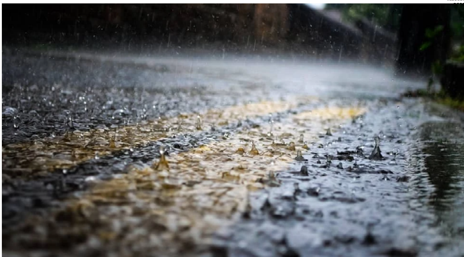
A prevenção e a mitigação desses problemas devem ser prioridades para garantir a segurança e o bem-estar da população

Os alagamentos e as dificuldades enfrentadas pelos moradores em decorrência das fortes chuvas ressaltam a necessidade de investimentos em infraestrutura para o adequado escoamento das águas pluviais na cidade.