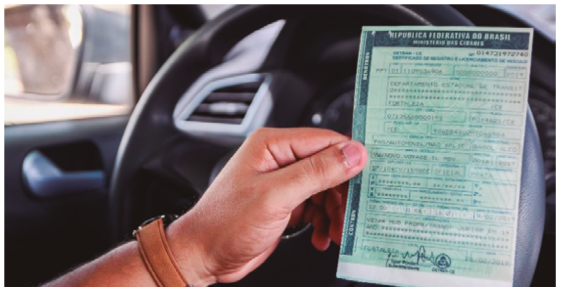
Os interessados têm até 120 dias para aderir ao programa de refinanciamento e se livrar do peso das dívidas com o Estado

Em ambos os casos abrangem os créditos tributários cujos fatos geradores ou prática de infração tenham ocorrido até 30 de junho de 2023. Abrange, inclusive, os créditos tributários ajuizados; decorrentes da aplicação de pena pecuniária; parcelados; não constituídos, desde que confessados espontaneamente; constituídos por meio de ação fiscal após o início da vigência desta Lei e os decorrentes de lançamento sobre o qual tenha sido realizada representação fiscal para fins penais. A proposta também permite a remissão do crédito tributário inscrito em dívida ativa até 31