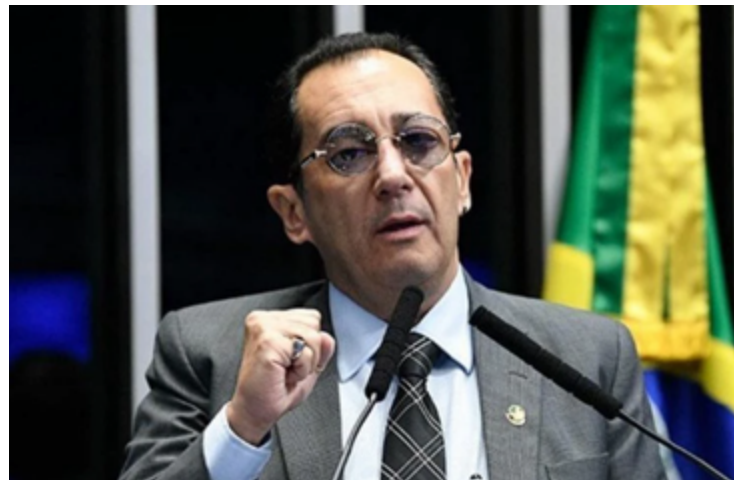
Jorge Kajuru: defesa do fim da reeleição