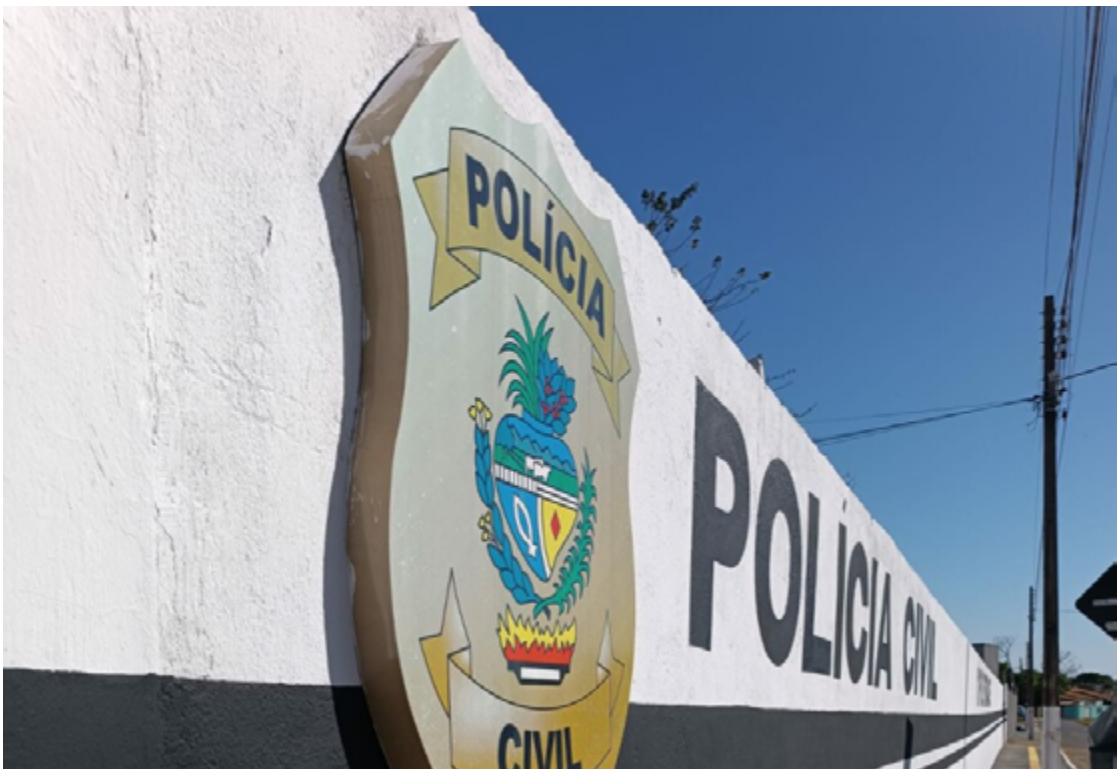
O caso permanece sob investigação para esclarecer todos os detalhes e garantir a punição adequada ao responsável pelos atos criminosos.

Após o ocorrido, o personal teria ainda, ameaçado o advogado de uma das vítimas, afirmando que “eles iriam se acertar”