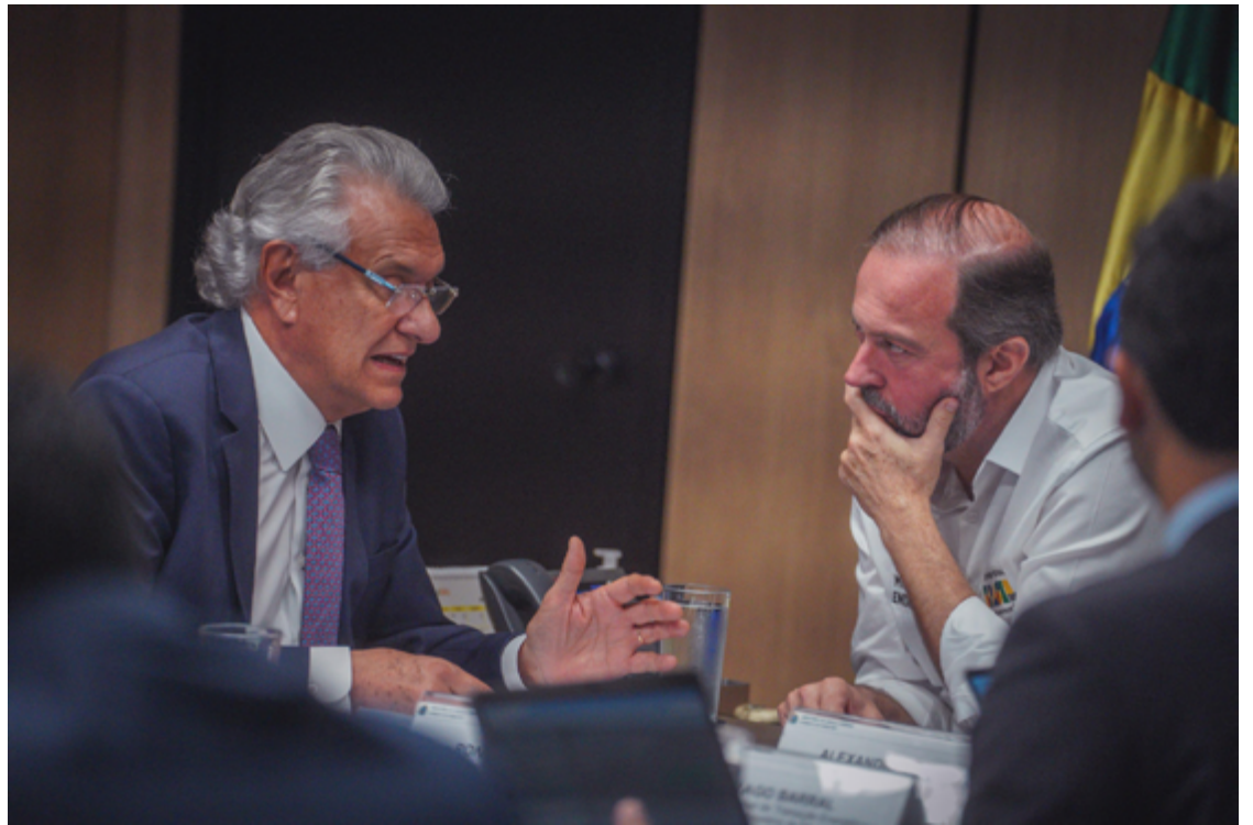
Ronaldo Caiado durante audiência com ministro de Minas e Energia, Alexandre Silveira: falta de energia atrapalha crescimento de Goiás

Crítico do sucateamento e venda da Celg para a Enel, o