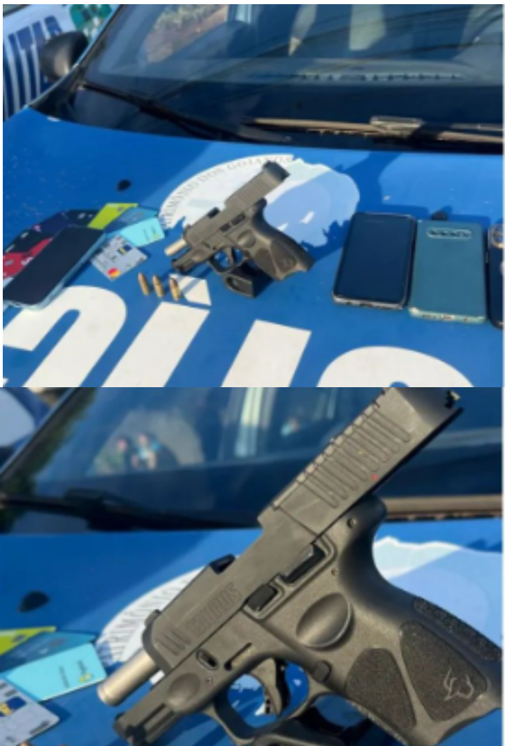
A ação policial em Novo Gama busca refletir o compromisso das autoridades em manter a ordem e a segurança pública na região

No último sábado (06), uma operação policial realizada em Novo Gama, resultou na prisão de três indivíduos encontrados portando uma arma de fogo de uso restrito. Segundo informações das autoridades militares envolvidas, a ação teve início quando um veículo levantou suspeitas. Durante um patrulhamento de rotina, policiais militares avistaram um automóvel em atitude suspeita nas proximidades de uma área residencial. Ao se aproximarem para averiguação, os agentes notaram a presença de três indivíduos dentro do veículo. Após uma busca minuciosa, os policiais descobriram que os ocupantes do veículo estavam portando uma arma de fogo de uso restrito, contendo três munições intactas. Diante da gravidade da situação, os três homens foram detidos e encaminhados à delegacia local para os procedimentos legais cabíveis. A ação policial em Novo Gama busca refletir o compromisso das autoridades em manter a ordem e a segurança pública na região. As investigações sobre o caso estão em andamento para esclarecer todos os detalhes e determinar as responsabilidades dos envolvidos de acordo com a legislação vigente.