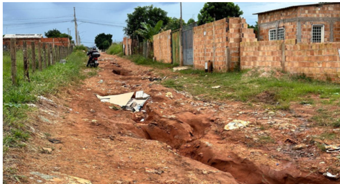
Os moradores estão desesperados, pois muitos veículos acabam atolando nessas condições precárias, resultando em danos materiais e prejuízos financeiros

Em alguns pontos, a situação é especialmente crítica, com as ruas transformadas em verdadeiros rios que escondem enormes crateras. Os moradores estão desesperados, pois muitos veículos acabam atolando nessas condições precárias, resultando em danos materiais