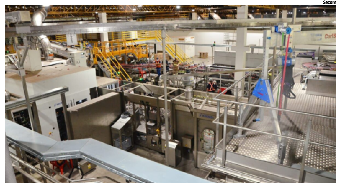
Indústria goiana tem a décima alta consecutiva, aponta pesquisa do IBGE