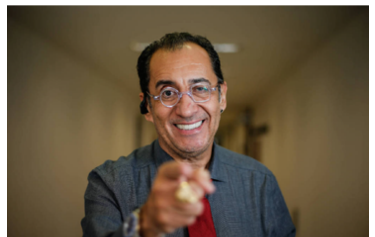
Jorge Kajuru: empresa será investigada pela CPI das Apostas

Ele também afirma que a partir de agora, por presidir a CPI, não fará mais propaganda pessoalmente desta bet ou de qualquer outra.