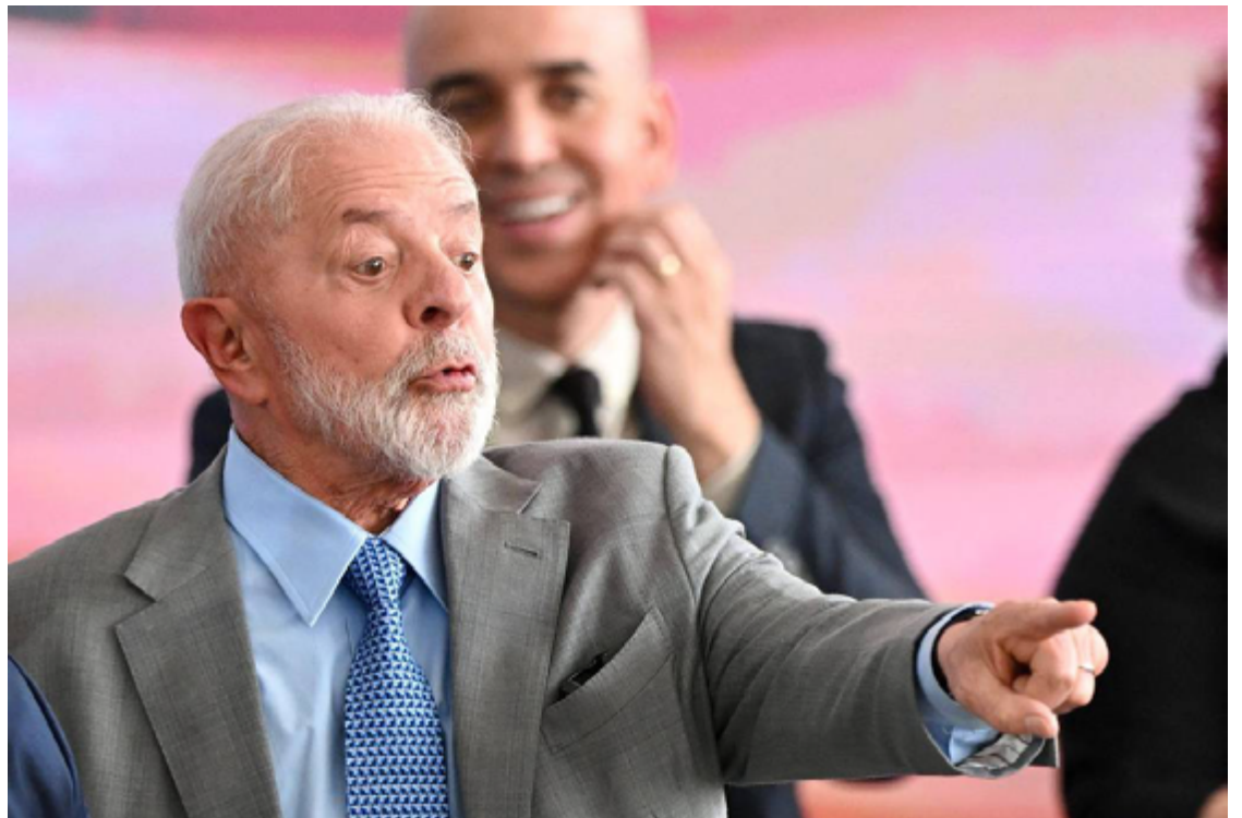
Lula da Silva: nenhuma contribuição Elon Musk ofereceu ao desenvolvimento do Brasil

Além de dono do X e da fabricante de veículos elétricos Tesla, Musk também é fundador da Space X, que desenvolveu avanços tecnológicos como a capacidade do foguete Falcon 9 de retornar ao solo e planos