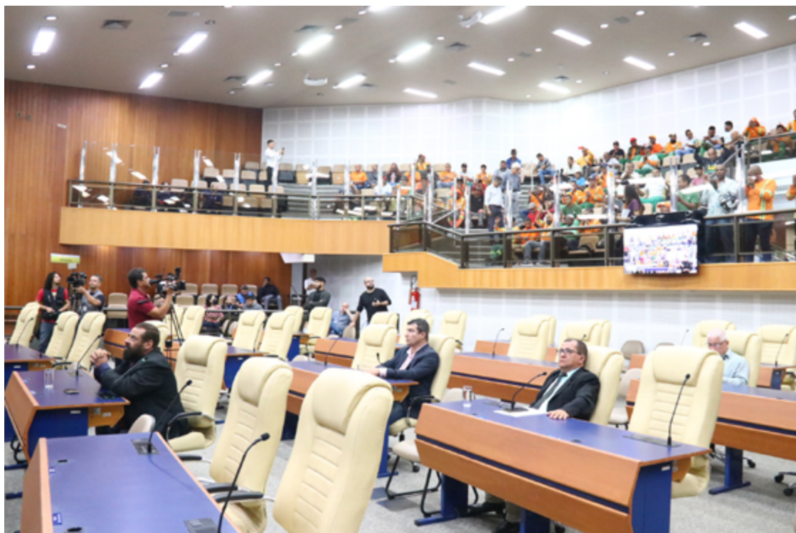
Câmara Municipal de Goiânia: novas bancadas de vereadores